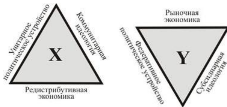
Рис. 2. Различие X- и Y- матриц

Для X-матрицы характерны такие базовые институты: